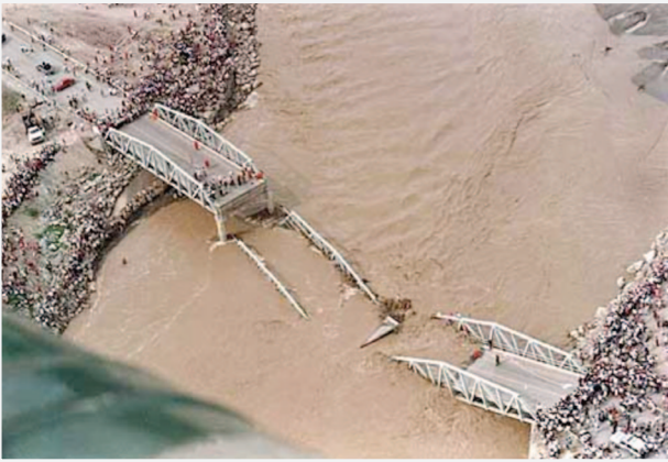
PUENTE REQUE (Marzo 1998)